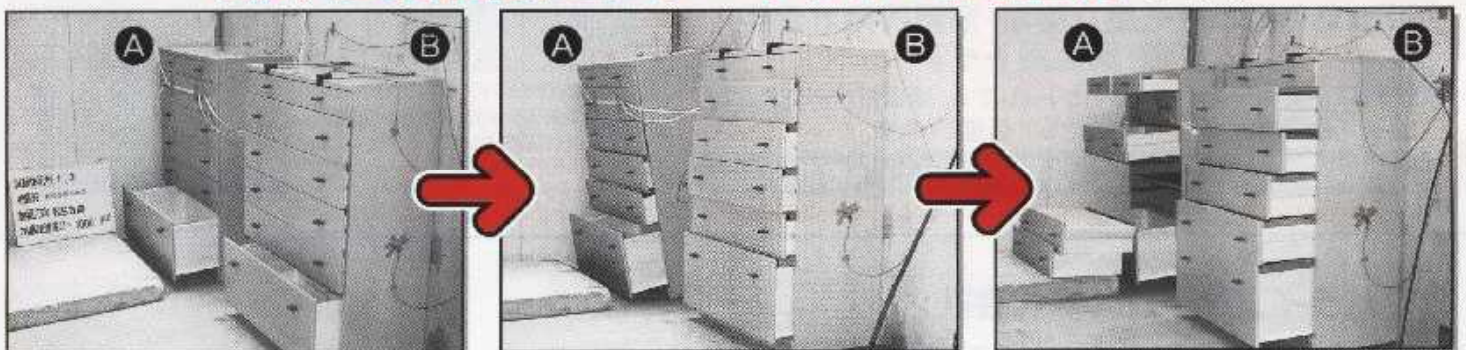
※Bは倒れストップベルト使用により、引出しの飛び出しを抑え、転倒を防止。