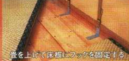
畳を上げて床板にフックを固定する

従来の方式では和室の家具の固定は大変難しい問題でした。 この問題を「倒れストップベルト」が見事解決しました。